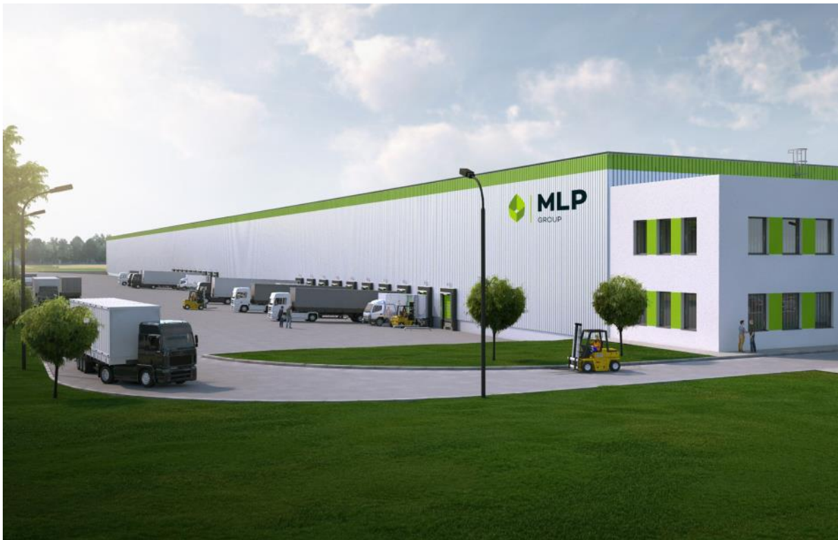
Przykładowa wizualizacja obiektu MLP Group

MLP Group wybuduje nowy park logistyczny na rynku rumuńskim. Inwestycja powstanie w pobliżu Bukaresztu na działce liczącej ponad 18,8 hektara. Docelowo obiekty będą oferowały około 80 tys. m 2 nowoczesnej powierzchni magazynowej.