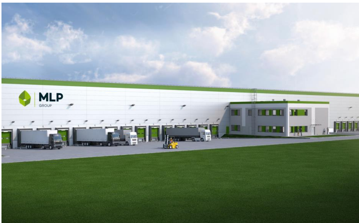
Przykładowa wizualizacja obiektu MLP Group

Deweloper powierzchni magazynowych MLP Group wspólnie z J.W. Construction Holding S.A. wybudują nowe centrum logistyczne w Szczecinie. Docelowa powierzchnia obiektów magazynowych w ramach projektowanego parku MLP Szczecin wyniesie około 60 tys. mkw.